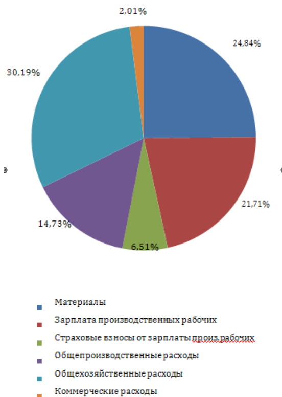
Рисунок 1- Структура калькуляции себестоимости

Оптовую цену изделия ( Ц_{оп} ) рассчитать по формуле (22):