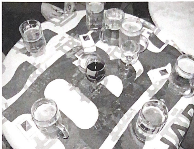
Пиво на Банк'е

1) В номинации “Супер-фото МБИ” победили: