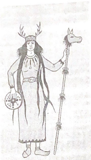
Рунический шаман-женщина в церемониальной одежде, с бубном и посохом, увенчанная маской в виде лошадиной головы