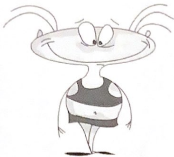
И ваша постоянная ведущая просто Масяня

Понедельник. Утро. Так-так... Оделась, вышла из дома и потащилась на работу. А завтракать кто будет? Где моя каша?! Ага, давай, покури еще... А вот я тебе сейчас кульбитик! Опа! Плохо, да? Нечего курить на голодный желудок. Что происходит вообще?!