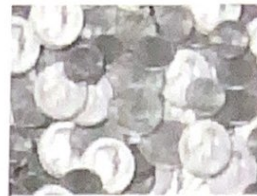
Это не обложка книги