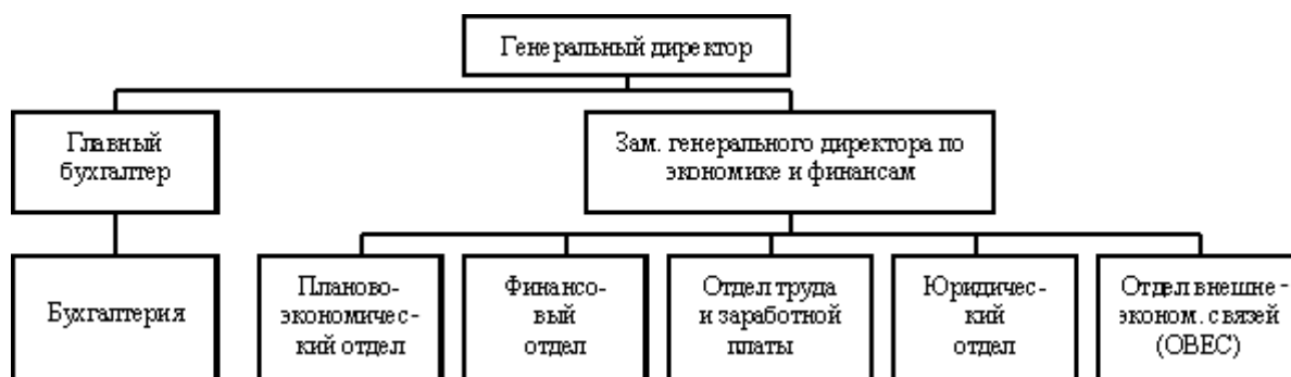
Рисунок 1 – Организационная структура предприятия

Например: при анализе организационной структуры предприятия может быть представлена ее схема (Рисунок 1).