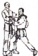
А ты держи и не отпускай!

Наконец-то, начались сами соревнования - решающий матч между представлявшим Россию питерским спортклубом "Явара-Нева" и сборной Японии, состоящий из двух раундов по 7 боёв в каждом. Справедливости ради стоит заметить, что в начале мы были не в восторге от происходящего и вообще мало что понимали, но вскоре в пределах нашей досягаемости обнаружился знаток-любитель, любезно объяснивший что к чему. Через 50 минут первая часть финала закончилась в пользу японских спортсменов со счетом 4:2. Мы расстроились... Но организаторы сделали все, чтобы поднять боевой дух команд и болельщиков! И в перерыве, растянувшись всего ничего на 40 минут, был устроен грандиозный концерт с участием ансамбля ударных инструментов,